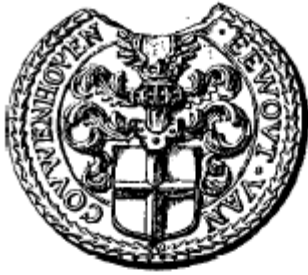
Ewout van Couwenhoven schepen van Rotterdam 1656 en 1657.