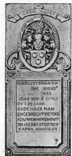
Maassluis, Grote Kerk, g.261